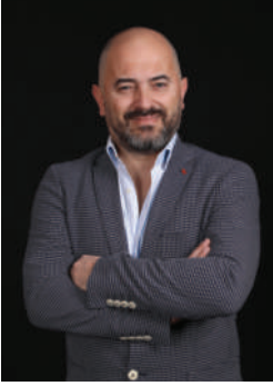
Ozan Bey Reklam Danışmanı