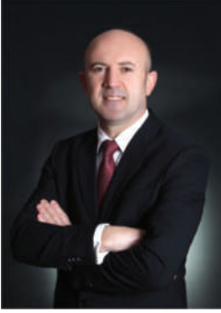
Turgay Bey Emlak Danışmanı